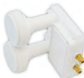
Vantage VT-Monoblock 6° Twin Art.-Nr. L1892 EAN: 4260097351638

Rauschmaß: 0,1 dB typ Feed Aufnahme: 23 mm Verpackung: im Karton Typ: VT-Monoblock 6° Twin