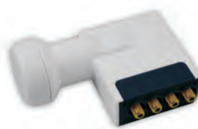
Vantage VT-Quad Art.-Nr. L1991 EAN: 4260097351614

Rauschmaß: 0,1 dB typ Feed Aufnahme: 40 mm Verpackung: im Karton Typ: VT-Quad