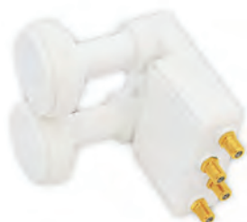
Vantage VT-Monoblock 6° Quad Art.-Nr. L1893 EAN: 4260097351645

Rauschmaß: 0,1 dB typ Feed Aufnahme: 23 mm Verpackung: im Karton Typ: VT-Monoblock 6° Quad