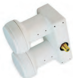
Vantage VT-Monoblock 6° Single Art.-Nr. L1891 EAN: 4260097351621

Rauschmaß: 0,1 dB typ Feed Aufnahme: 40 mm Verpackung: im Karton Typ: VT-Monoblock 6° Single