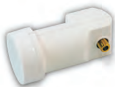
Vantage VT-Single Art.-Nr. L1591 EAN: 4260097351584

Rauschmaß: 0,1 dB typ Feed Aufnahme: 40 mm Verpackung: im Karton Typ: VT-Single