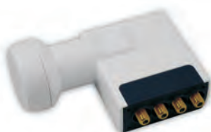
Vantage VT-Quattro Art.-Nr. L1691 EAN: 4260097351607

Rauschmaß: 0,1 dB typ Feed Aufnahme: 40 mm Verpackung: im Karton Typ: VT-Quattro