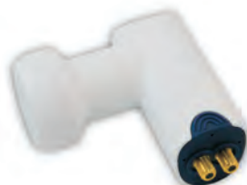
Vantage VT-Twin Art.-Nr. L1791 EAN: 4260097351591

Rauschmaß: 0,1 dB typ Feed Aufnahme: 40 mm Verpackung: im Karton Typ: VT-Twin